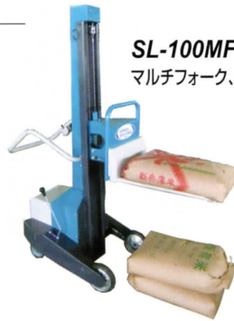
SL-100MF マルチフォーク、テーブル荷台

各種コンテナ用フォーク リモートスイッチ CT用コンテナフック等 アタッチメントも 豊富にあります。