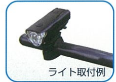
※ライトは付属しません。