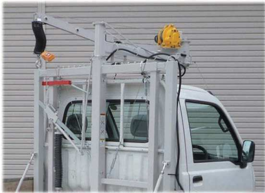
走行時はキャビン側へ収納・固定(軽トラ)