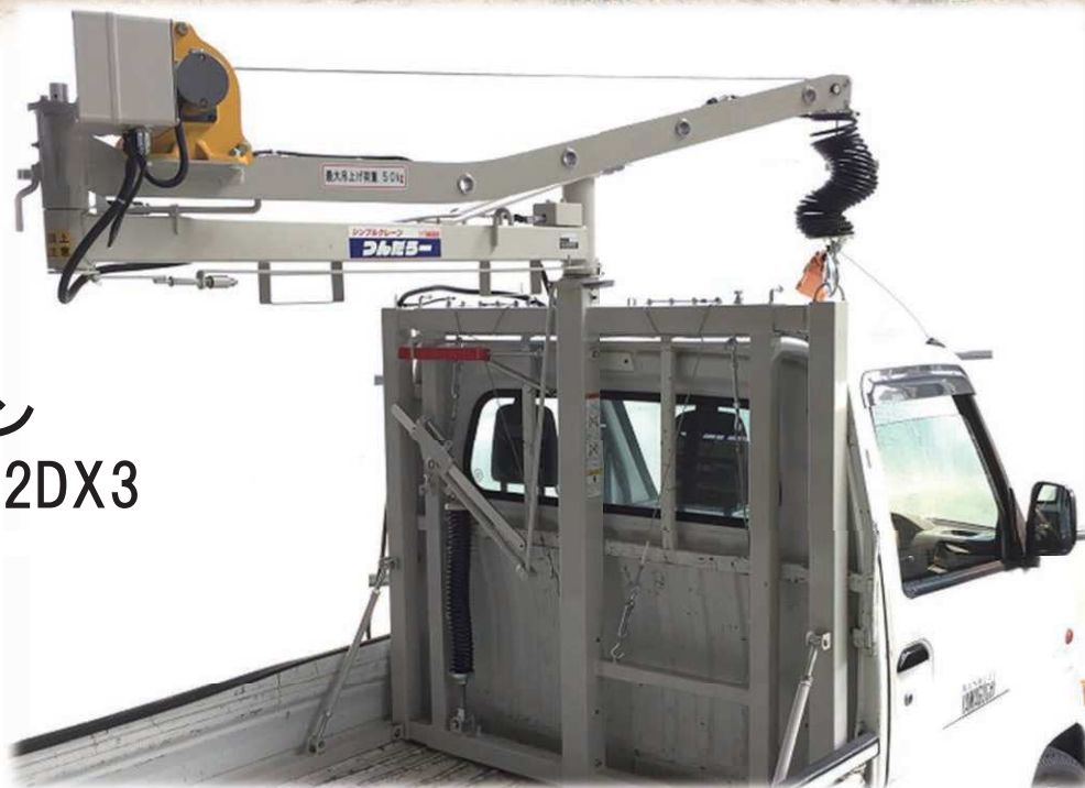
シンプルクレーン つんだろーSC-32DX3