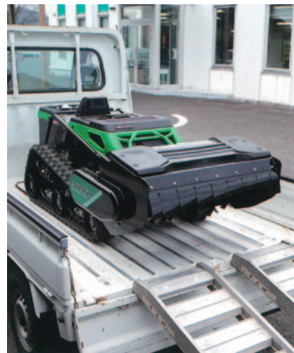
軽トラ積載可能(重量260kg)